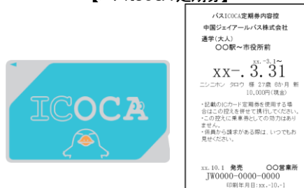
<バスICOCA 定期券内容控>