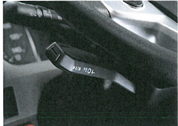
・シーケンシャルレバー マニュアルモードへの切替やギヤの UP/DOWN を行います。