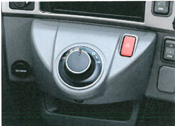
・ギアセレクター ダイヤル操作によりギヤの切替を行います。

クラッチ操作が不要な変速装置で、走行状況に応じて手もとで自在に変速を切り替えられるマニュアルモードと、ギヤ段を自動的に選択するオートマチックモードの選択が可能です。燃費効率の良い走行やドライバーの負担軽減に貢献します。